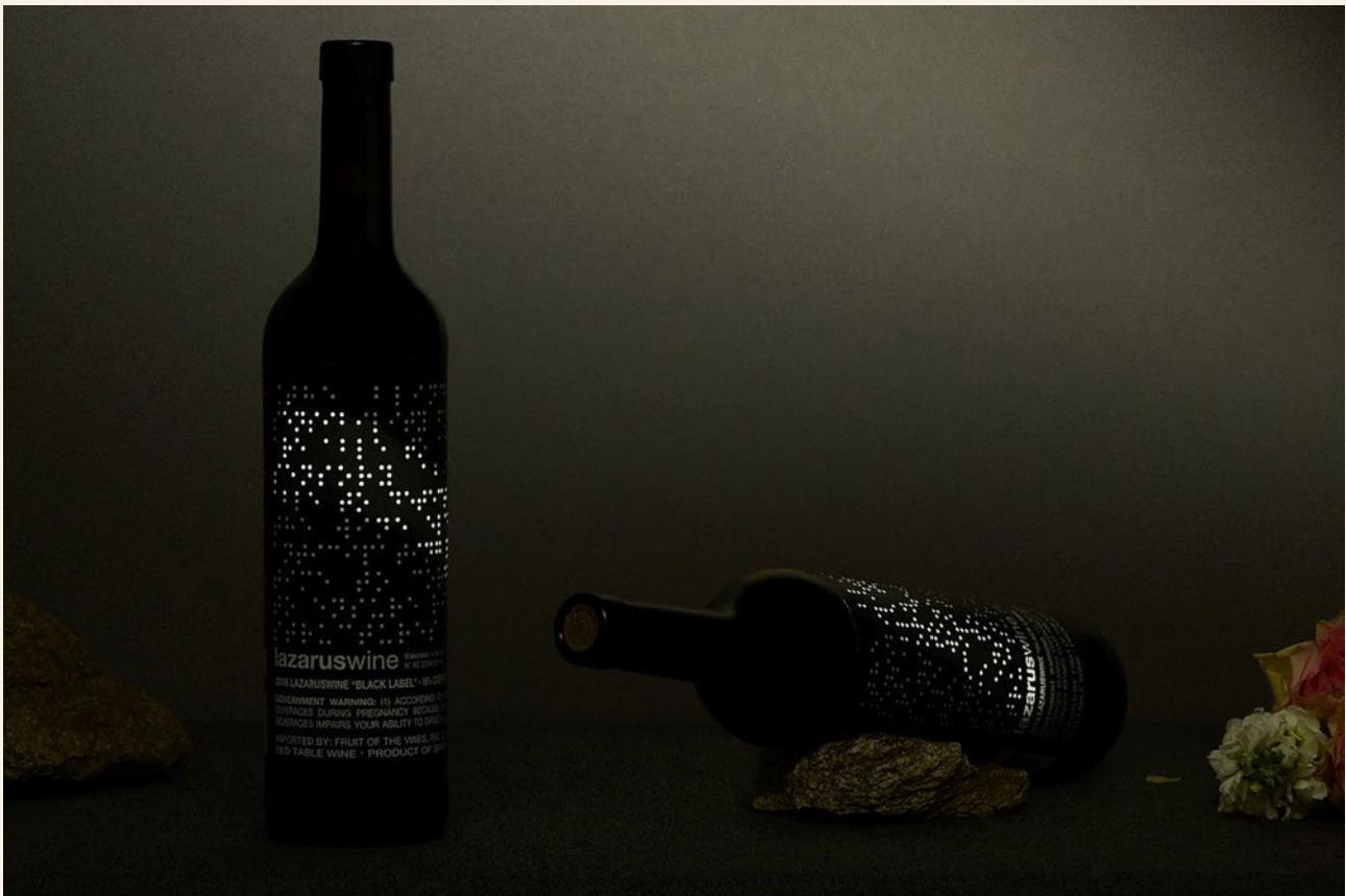
Lazaruswine, von blinden Winzern kreiert: Bodegas Edra, Ribera Gallego – Cinco Villas, Spanien