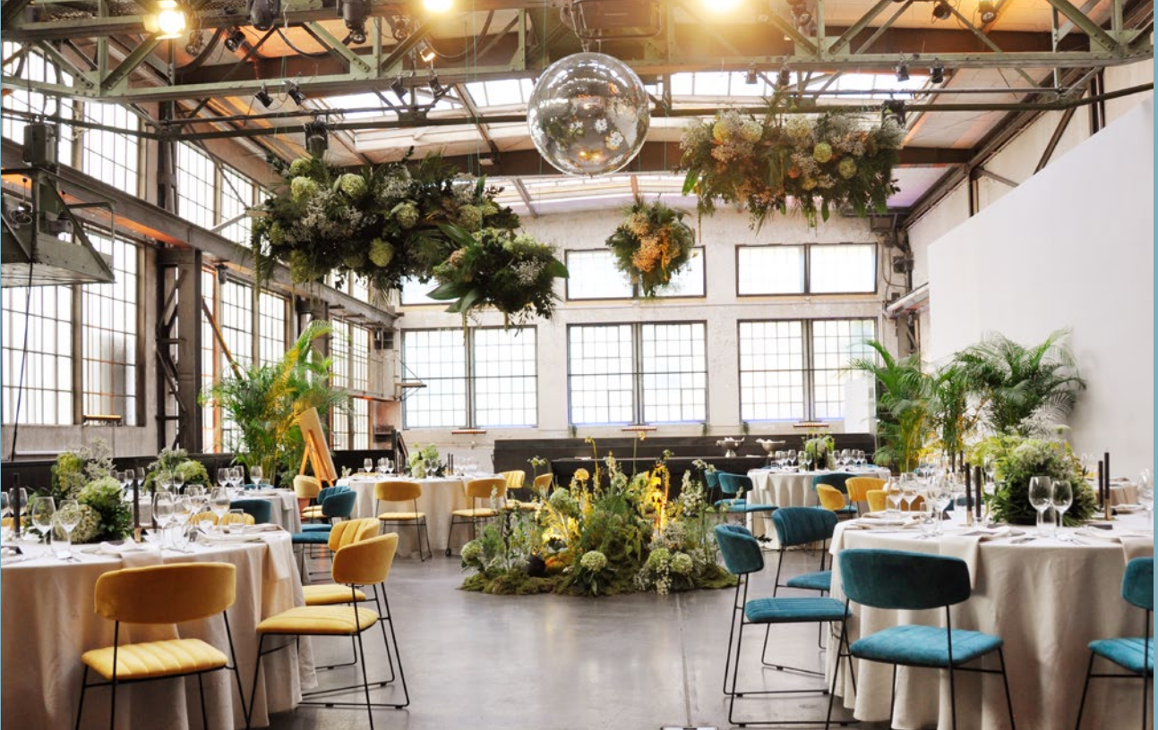
Halle 7, Dekoration durch Rosepepper