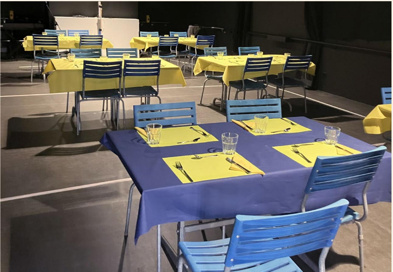
Dunkelrestaurant Blindenschule Zollikofen

Besucherinnen und Besucher. Im Zürcher Dunkelrestaurant wurden 18 842 (Vorjahr 20 854) und im Basler Restaurant 6991 (Vorjahr 6868) Besucherinnen und Besucher verzeichnet. Zu den Events in der Halle 7 (Basel) kamen 10 708 (Vorjahr 9956) Personen. Gesamthaft wurden in Basel 17 699 Gäste gezählt.