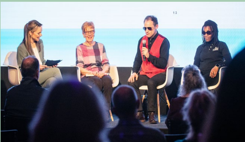
Podiumsgespräch am Jubiläumsanlass