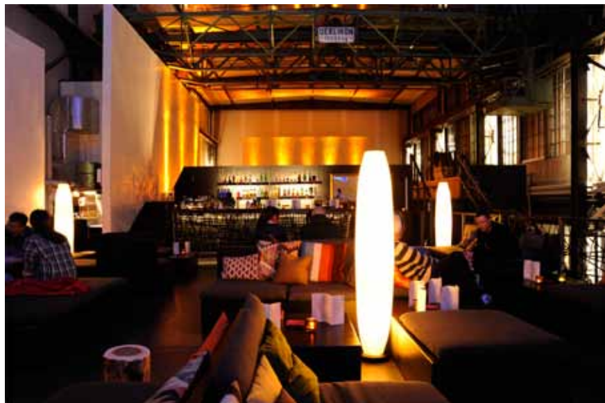
Halle 7 blindeküh Basel

2018 wurden im Dunkelrestaurant der blindeküh Basel drei gut besuchte DinnerKrimis der Peter Denlo Production aufgeführt. Konzerte im Dunkeln fanden keine statt.