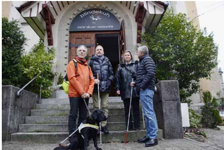
Die Gründer der blindeküh

Damit die blindeküh Zürich auch zukünftig attraktiv für ihre Gäste ist, wird der Empfangsbereich saniert. An der Finanzierung beteiligen sich u.a. die Stadt Zürich und der Lotteriefonds des Kantons Zürich.